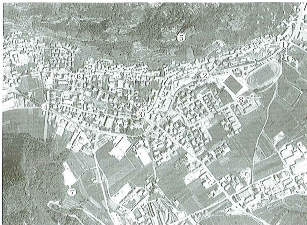
Fig. 1 - Mappa delle stazioni. (Nulla osta dell'IGM alla diffusione N. 280 del 22/07/1996 e N. 475 del 18/12/1996 controllato ai sensi della legge N. 68 del 2/2/1960)

Per il monitoraggio attivo si è fatto riferimento ai lavori di Bendetta (1977) e Matassoni e Zorer (1987), che hanno utilizzato talli di Hypogymnia physodes (L.) Nyl. per monitorare la qualità dell'aria rispettivamente a Bolzano ed a Rovereto. Sono state allestite 9 tavolette di legno dalle dimensioni di 20 x 50 x 3 cm (altezza x larghezza x profondità) portanti ciascuna