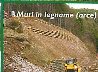
Muri in legname (arce)