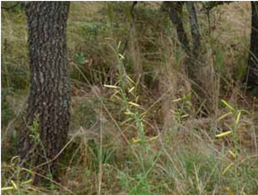
Figura 8: Asfodelo della Liburnia osservato nel sottobosco del fragneto.