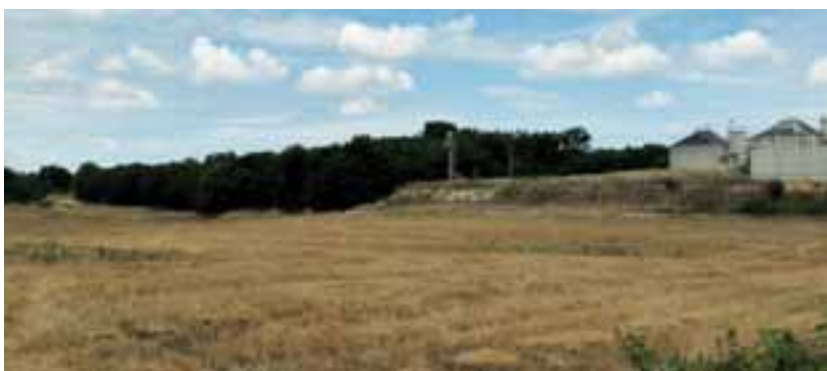
Figura 3: Particolare del boschetto di fragno e del vicino depuratore