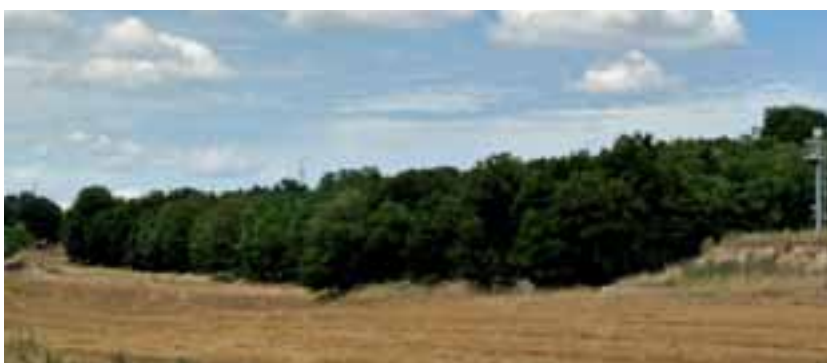
Figura 4: Particolare del boschetto di fragno osservato dal fondo del torrente La Badessa.

Al fine di comprendere al meglio gli aspetti mesoclimatici e bioclimatici dell'area sono stati analizzati i dati registrati presso la vicina stazione termopluviometrica di Casamassima (223 m s.m.), ritenuta più aderente alle condizioni in cui si osserva il boschetto e preferita a quella di Cassano delle Murge che già si rinvia in piena Murgia Alta a 410 m s.m..