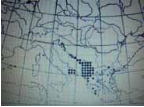
Figura 1: Areale naturale di Quercus trojana (estratto da JALAS & SUOMINEM, 1976).