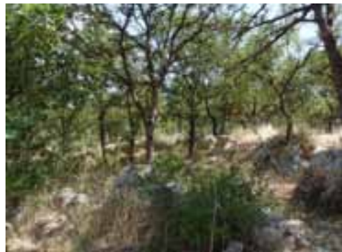
Figura 7: Banchi rocciosi in affioramento.

Nello strato erbaceo si osservano invece Clinopodium vulgare , Asphodeline liburnica (Figura 8), Rubia peregrina , Buglossoides purpuro-coerulea . La limitatezza dell'estensione della fitocenosi rende inevitabile l'ingresso di specie tipiche degli spazi aperti limotrofi e degli incolti quali Melica ciliata , Dactylis hispanica , Dasypirum villosus , Oryzopsis miliacea , Avena sp. Localmente si osservano episodi di rinnovazione di fragno.