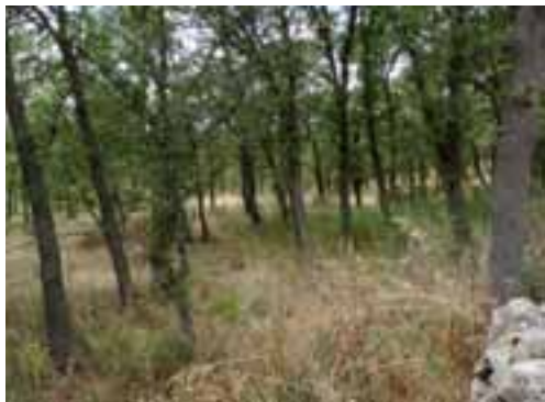
Figura 6: Particolare del boschetto di fragno.

valori medi osservabili in una boscaglia di quercia virgiliana dell'area. Lo strato arbustivo è nel complesso poco rappresentato anche se localmente si osservano delle plaghe arbustive dove entrano il biancospino ( Crataegus monogyna ), il rovo ( Rubus ulmifolius ), il prugnolo comune ( Prunus spinosa ), il mega-leppo ( Prunus mahleb ), la fillirea ( Phillyrea latifolia ), la ginestrella ( Osyris alba ), l'asparago pungente ( Asparagus acutifolius ).