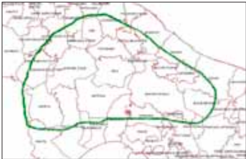
Figura 2: Areale italiano di Quercus trojana .

L'areale italiano (Figura 2) invece come già anticipato, coincide quasi completamente con le Murge di Sud-Est. Le ultime apparizioni del fragno sui gradini più elevati murgiani (Murgia Alta) si osservano a Santeramo, dove il fragno è ancora ben rappresentato e a Cassano delle Murge dove la specie è osservabile nella porzione più orientale dell'agro al confine con Santeramo ed Acquaviva (Bosco di Mesola), per poi scomparire e lasciare il posto alla quercia virgiliana.